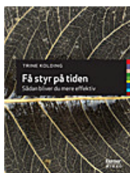
Få styr på tiden