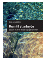
Rum til at arbejde