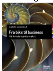
Fra biks til business